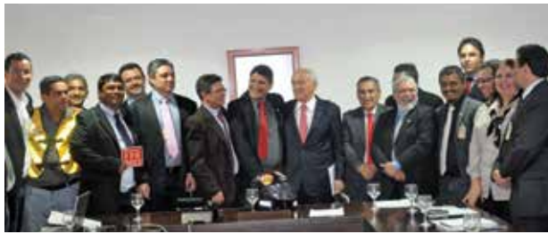
SindimotoSP esteve no mês passado com o ministro do Trabalho e Emprego Manoel Dias e o ministro-Chefe da Secretaria-Geral da Presidência da República do Brasil, Gilberto Carvalho, reivindicando o adicional de insalubridade para o motofretista.

Aprovação por unanimidade pelos senadores é reflexo do trabalho do SindimotoSP que, há dois anos vem participando de reuniões com o Governo Federal e o Senado reivindicando o pagamento para à categoria.