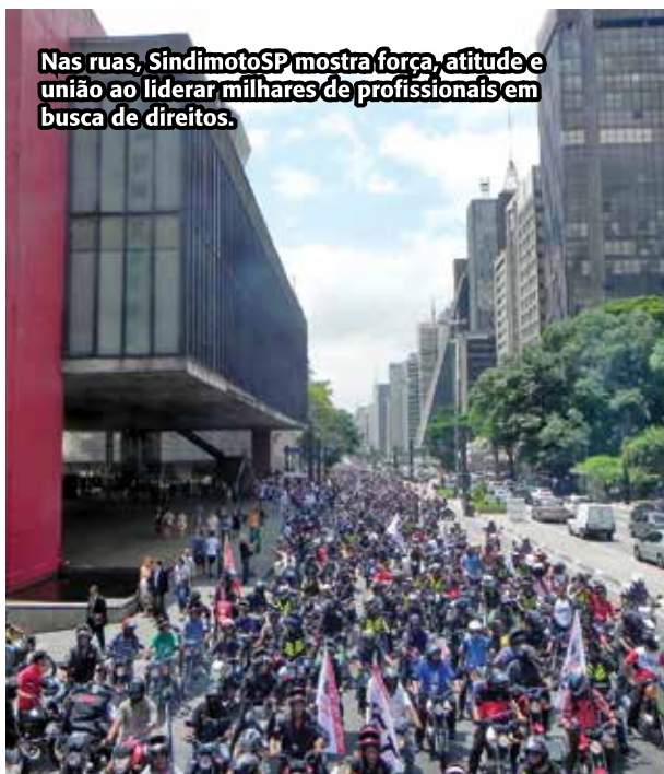
Nas ruas, SindimotoSP mostra força, atitude e união ao liderar milhares de profissionais em busca de direitos.