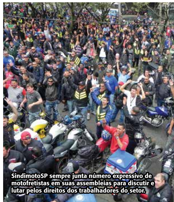
SindimotoSP sempre junta número expressivo de motofretistas em suas assembleias para discutir e lutar pelos direitos dos trabalhadores do setor.