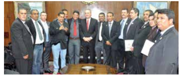
Com o presidente do Senado Federal Renan Calheiros, SindimotoSP conseguiu apoio para o projeto ser aprovado e encaminhado para sanção ou veto da presidenta Dilma Rousseff.

Em todo esse período, o SindimotoSP explicou para todos parlamentares envolvidos não só a importância desse pagamento ao motofretista como também ser um direito trabalhista, conforme dados do Corpo de Bombeiros de São Paulo segundo o qual, a capital paulista registra média diária de dois motociclistas mortos e oito com lesões permanentes por acidentes de trânsito. Os senadores aprovaram por unanimidade o texto lembrando que os motociclistas são os mais atingidos pelos acidentes de trâm-