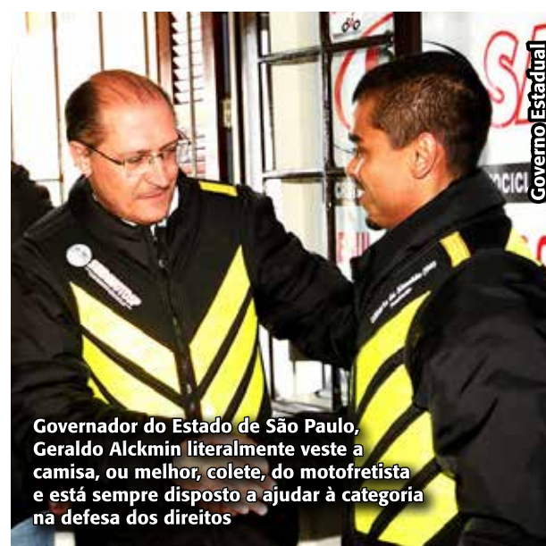
Governador do Estado de São Paulo, Geraldo Alckmin literalmente veste a camisa, ou melhor, colete, do motofretista e está sempre disposto a ajudar à categoria na defesa dos direitos