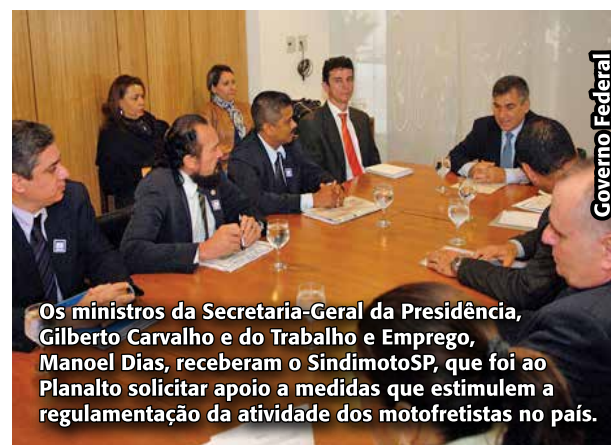
Os ministros da Secretaria-Geral da Presidência, Gilberto Carvalho e do Trabalho e Emprego, Manoel Dias, receberam o SindimotoSP, que foi ao Planalto solicitar apoio a medidas que estimulem a regulamentação da atividade dos motofretistas no país.

O SindimotoSP não atua apenas na área trabalhista e, em parceria com os Governos Municipal / Estadual / Federal, tem projetos para as atividades dos motociclistas e profissionais voltados a pesquisa, educação, comunicação, eventos, legislação, trânsito, transporte, regulamentação, qualificação, atividade e normatização do setor de duas rodas, com intuito de reduzir os acidentes, melhorar a imagem dos motociclistas e responsabilidade social e ainda promover ações em prol dos motociclistas na Década de Segurança 2011-2020 – projeto organizado pela ONU.